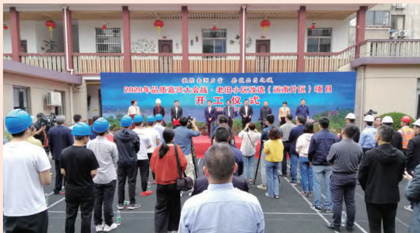
常务副区长徐明良,南湖区委副书记张芳军等领导出席开工仪式。公司董事

5月1日上午,由我公司承建的“2020年品质嘉兴大会战·老旧小区改造(运南片区)项目”开工仪式在新兴街道运南社区举行,这是嘉兴市首个以“划片改造”新模式启动“焕颜程序”的老旧住宅片区(项目)。嘉兴市住房和城乡建设局局长、市中心城市品质提升办公室常务副主任应志敏,南湖区委副书记、区长邵潘锋,嘉兴市住房和城乡建设局副局长、市中心城市品质提升办公室小区小巷专项组组长陆芸,嘉兴市科协副主席、市中心城市品质提升办公室小区小巷专项组副组长孙明,南湖区委常委、