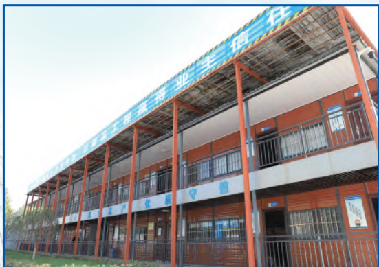
现代化的现场办公区整洁漂亮，令人耳目一新