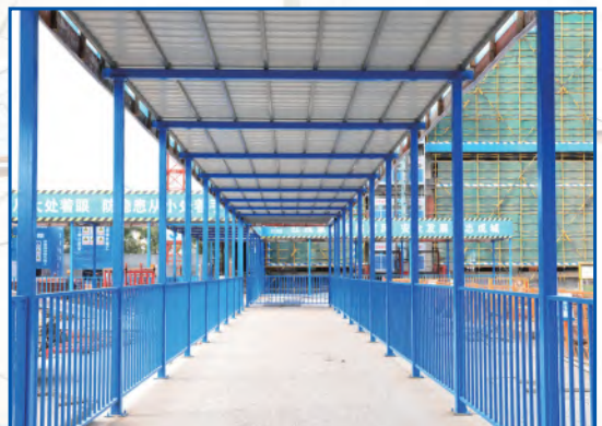
安全通道按标准建设，安全畅通