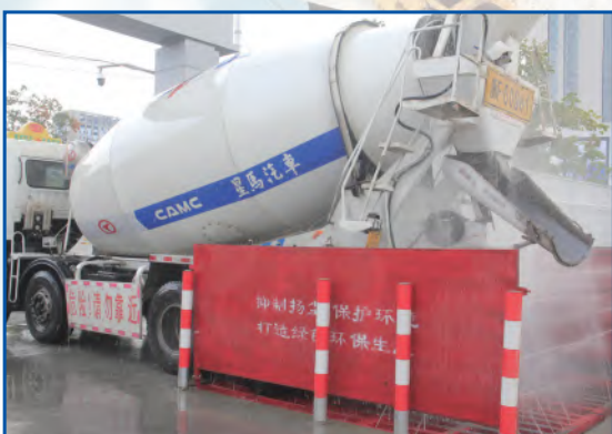
自动冲洗设施和高压水枪配备完善，绿色环保