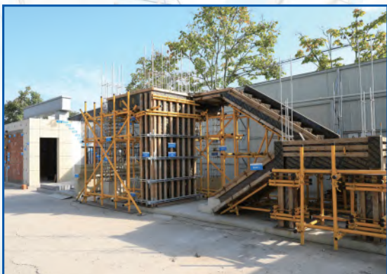
工艺样板展示区展现每个工艺细节