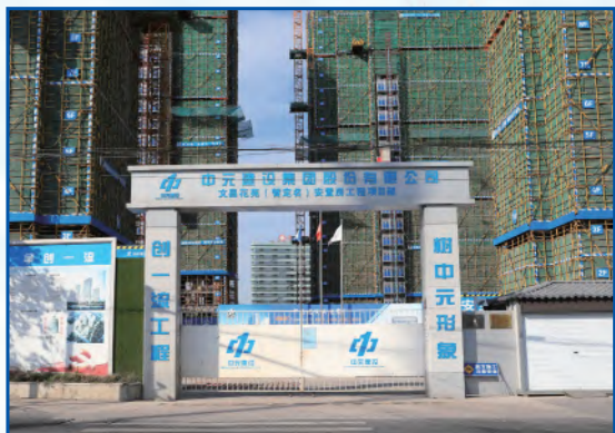
项目入口处，企业形象和工程信息一目了然