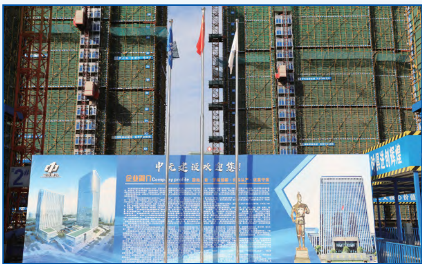
企业形象展示区，弘扬匠心精神

目前，文昌花苑项目主体结构已完成至24层楼面，预计12月中旬结顶，拔地而起的一幢幢高楼正逐渐成为城市一道独特的风景线。文昌花苑项目团队将继续在确保工程质量安全的前提下，攻坚克难、砥砺实干，向人民群众交上一份满意答卷。