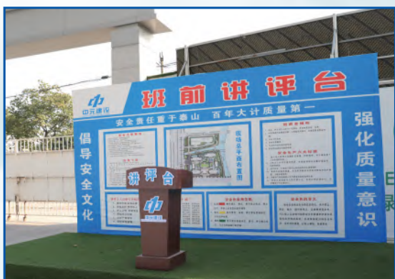
班前讲评台为项目安全施工打下坚实基础