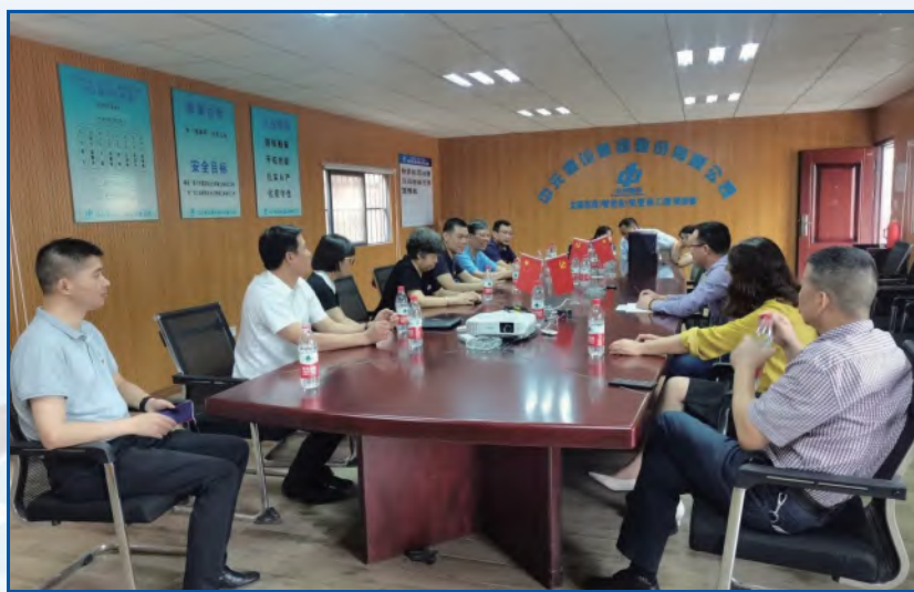
南湖区委王书记带队来项目检查，为项目点赞