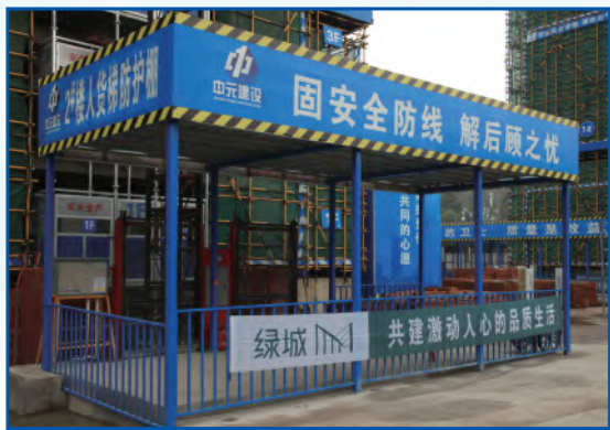
定型化人货梯防护棚标志清晰，筑牢安全防线