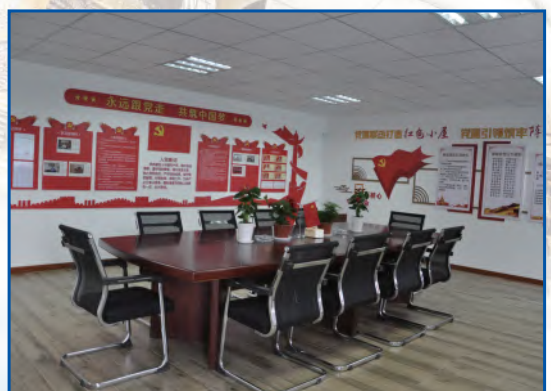
建设“红色工地”，发挥党组织战斗堡垒作用