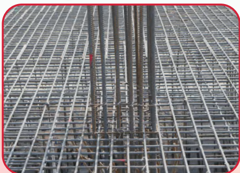
钢筋工程：底板柱钢筋定位准确、绑扎牢固、吊钩设置规范