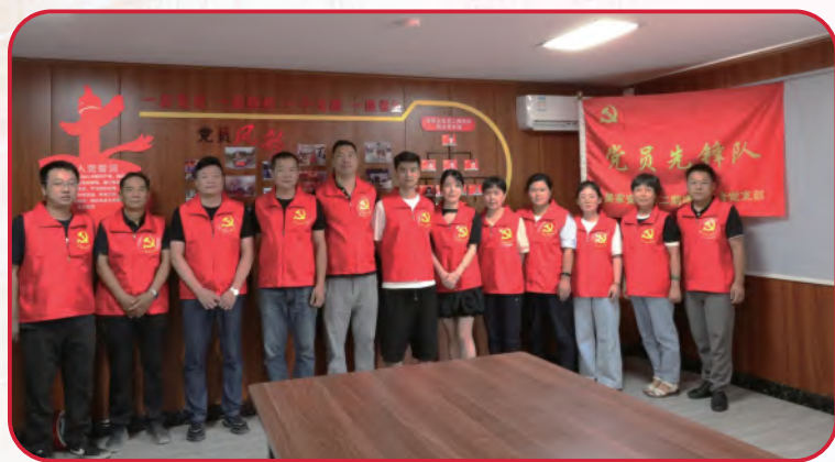
党建引领 精品工程