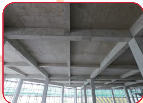
混凝土工程：梁墙节点线条顺直美观