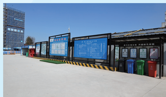
项目场地干净整洁、垃圾分类存放