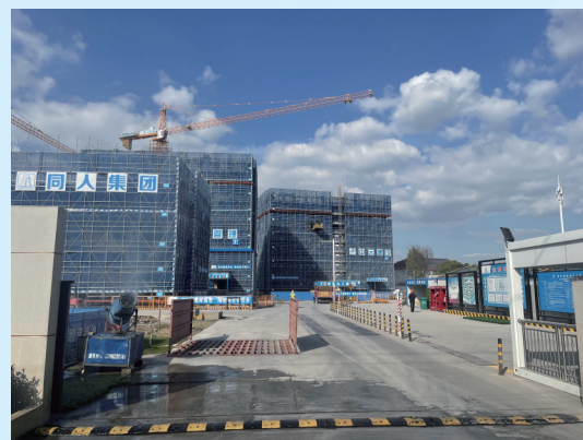
工地大门配备车辆自动冲洗设备