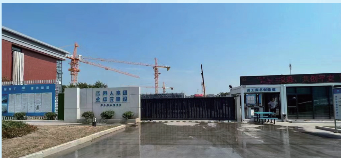
封闭式大门、实名制管理