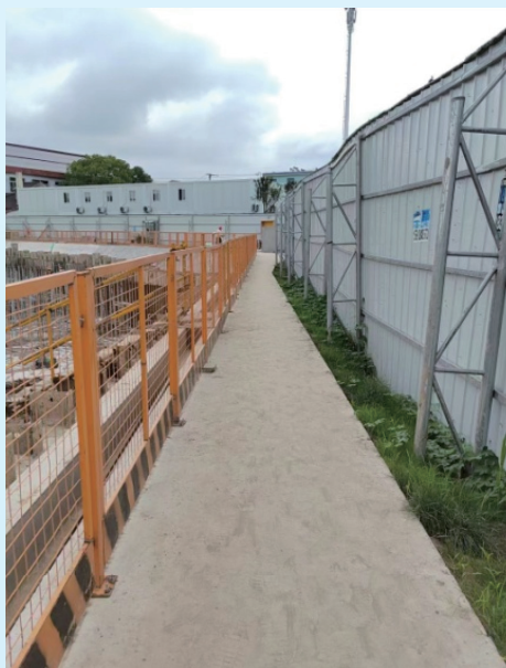
采用“定型化”临边防护