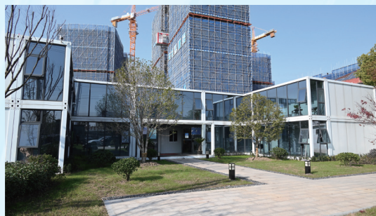
项目办公区整洁大气